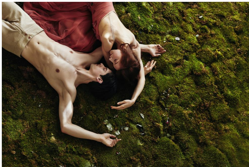
Las cuatro estaciones. © Tata Baeva

El compositor nacido en Hamelín, Alemania, y criado en Reino Unido, lo justificaba: « Las cuatro estaciones es una música que todos llevamos con nosotros. Está por todas partes. De alguna manera, hemos dejado de oírla. Así que este proyecto, personalmente para mí, es una forma de reclamar esta música entrando en ella y redescubriéndola por mí mismo, tomando una senda nueva por un paisaje muy bien conocido».