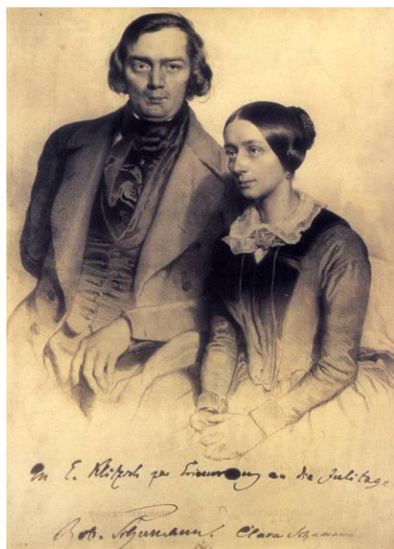
Robert y Clara Schumann, 1847

Ya en la última etapa de sus vidas, fallecido Schumann en 1856 y Brahms colaborando constantemente con Clara, para quien escribió más de una decena de obras, le dedica una serie de gran intensidad y belleza suma, como son las Seis piezas para piano, op. 118 de su catálogo, de las cuales escuchamos hoy el Intermezzo núm. 2, en que muestra la fortaleza de su escritura, un notable ejercicio de contrapunto y solidez armónica, a la vez que un discurso sereno y profundo de quien ha brindado y compartido un amor situado por sobre todas las cosas.