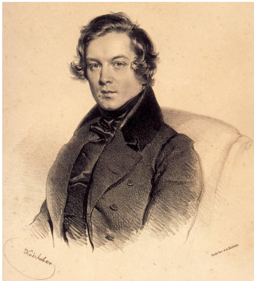
Robert Schumann, litografía de Joseph Kriehuber, 1839.

La introducción Grave es una de las manifestaciones más elocuentes del uso profundamente expresivo y el carácter trágico de la tonalidad de do menor en manos de Beethoven. Esta sección (en la que Deryck Cooke ha visto con gran perspicacia el modelo para el inicio del Tristán e Isolda de Wagner) cumple la función propia de las introducciones lentas típicas en numerosas obras (normalmente orquestales) de Haydn y Mozart, pero Beethoven, con una originalidad asombrosa, le da al Grave de su op. 13 un papel totalmente nuevo haciéndolo reaparecer en otras partes del movimiento, y derivando de él una parte substancial del material temático del Allegro di molto e con brio . Como maestro supremo del contraste, Beethoven hace que la opresiva agitación del primer movimiento sea sucedida por la dulzura y equilibrio del Adagio cantabile en la bemol mayor. Se trata de una de las melodías más bellamente serenas de Beethoven, cuya Décima Sinfonía hubiera comenzado con una reminiscencia de la misma, según la reconstrucción de sus esbozos realizada por Barry Cooper.