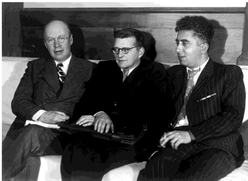
En la imagen, de izquierda a derecha, Serguei Prokofiev, Dmitri Shostakovich y Aram Khachaturian en 1940.

camerísticas, había surgido pocos meses después de su colaboración en el festival Primavera de Praga de 1947. Durante el otoño de ese año Shostakovich tuvo conocimiento de que la cantata que acababa de escribir para conmemorar el trigésimo aniversario de la Revolución de Octubre (el Poema de la Patria , op. 74) era rechazada. Un hecho inquietante que serviría como prólogo a la campaña represiva llevada a cabo por Zhdanov a comienzos de 1948, cuando Shostakovich, Prokofiev, Miaskovsky y Khachaturian, entre otros, fueron condenados por incurrir en «perversiones formalistas y tendencias antidemocráticas ajenas al pueblo soviético».