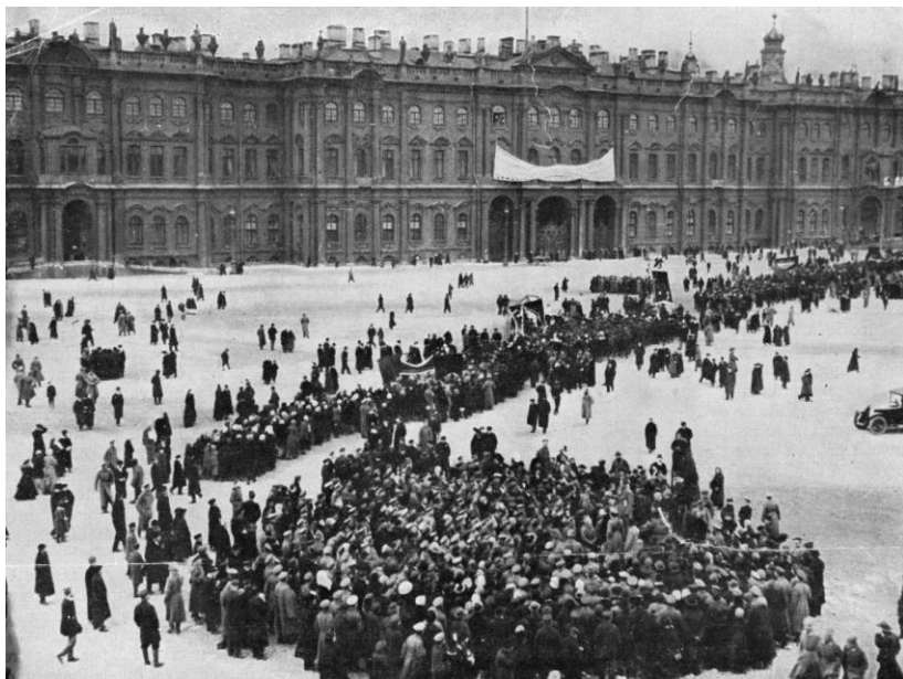
Asalto al Palacio de Invierno. Petrogrado, 7 de noviembre de 1917.

Marcha fúnebre por las víctimas de la Revolución. El nombre del conciso tercer movimiento, Aurora , alude al crucero homónimo cuyo primer