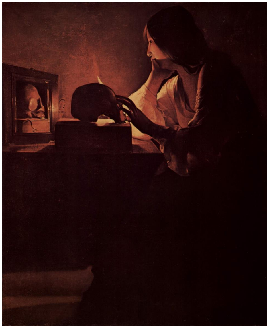
Georges de La Tour, María Magdalena penitente