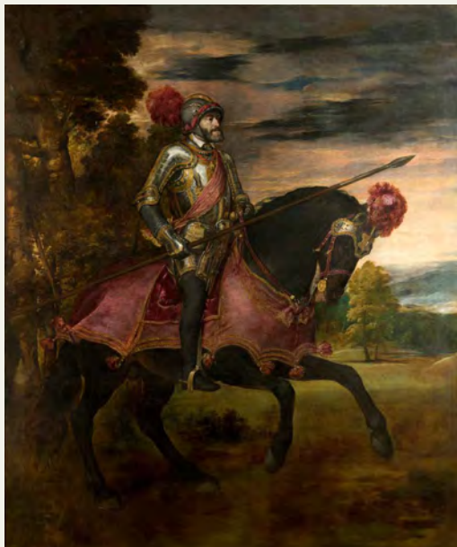
Tiziano, Carlos V en la Batalla de Mühlberg, 1548. Museo del Prado