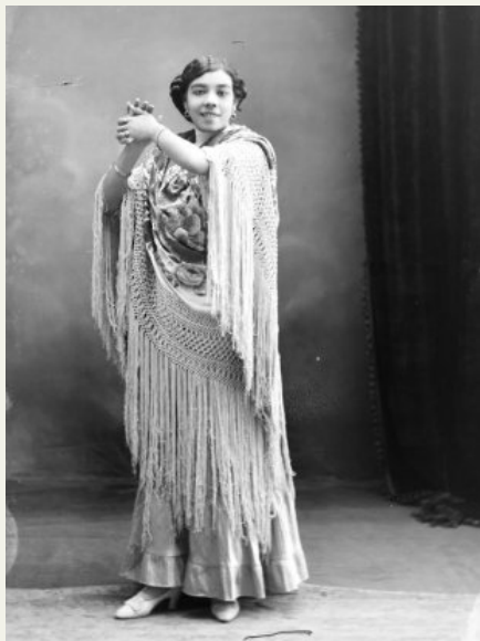
Pastora Pavón, La Niña de los Peines.