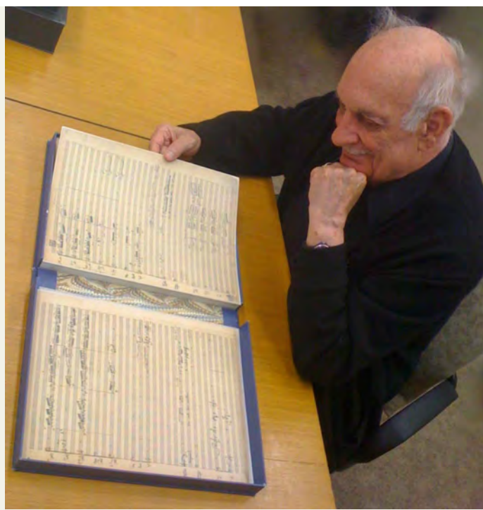
George Crumb.

Se presentan los cuatro libros de los Madrigals para soprano, flauta, arpa, contrabajo y percusión. Mediante esta heterogénea plantilla, el ganador del Premio Pulitzer en 1968 logró crear un ambiente sonoro específico para cada uno de los doce extractos de poemas y otras piezas teatrales de Lorca ( El Diván del Tamarit, Canciones, Bodas de sangre... ). En The Ghosts of Alhambra retumban los ecos andaluces a través de siete poemas extraídos de Poema del cante jondo y gracias a la presencia de la guitarra, a la que el propio Lorca dedicó unos bellísimos versos.